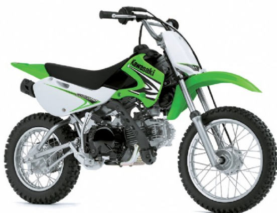
Modell Év: 2008