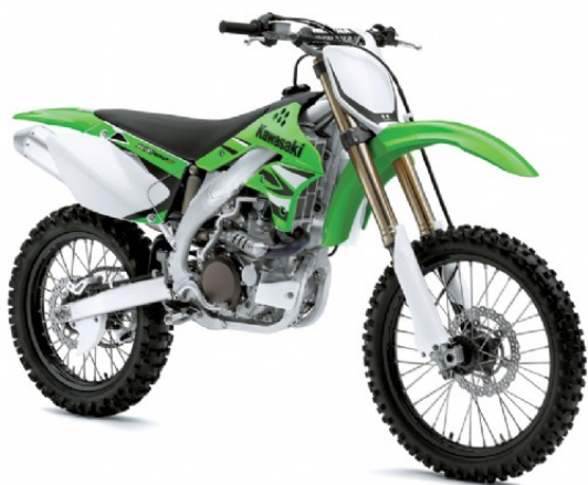
Modell Év: 2008