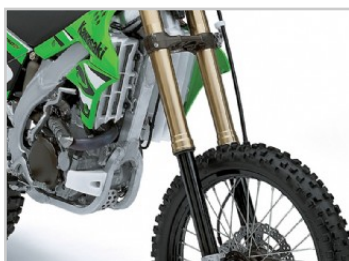
Kayaba AOS villa