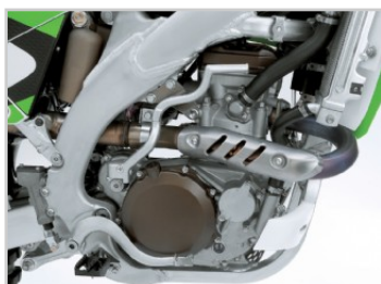
Izmos teljesítmény a gyári hangolású blokkal