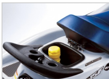
Ülés alatti tárolás