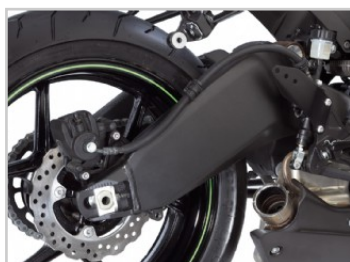
Lengőkar felső tagra szerelt stabilizátorral